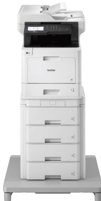
MFC-L8900CDW z podajnikiem wieżowym TT-4000 i adapterem TC-4000

W zależności od tego, jak dużo zamierzasz drukować, każdy z modeli należący do tej gamy można rozbudować o opcjonalne akcesoria, dzięki czemu będzie odpowiadał Twoim indywidualnym potrzebom.